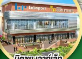
มิคซุย เอท่าเล็ก พาร์ค คาโตมะ