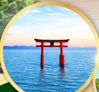
ทะเลสาบบิวะ - เสทโรรี