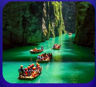
“ ผิงซานแกรนด์แคนยอน ”