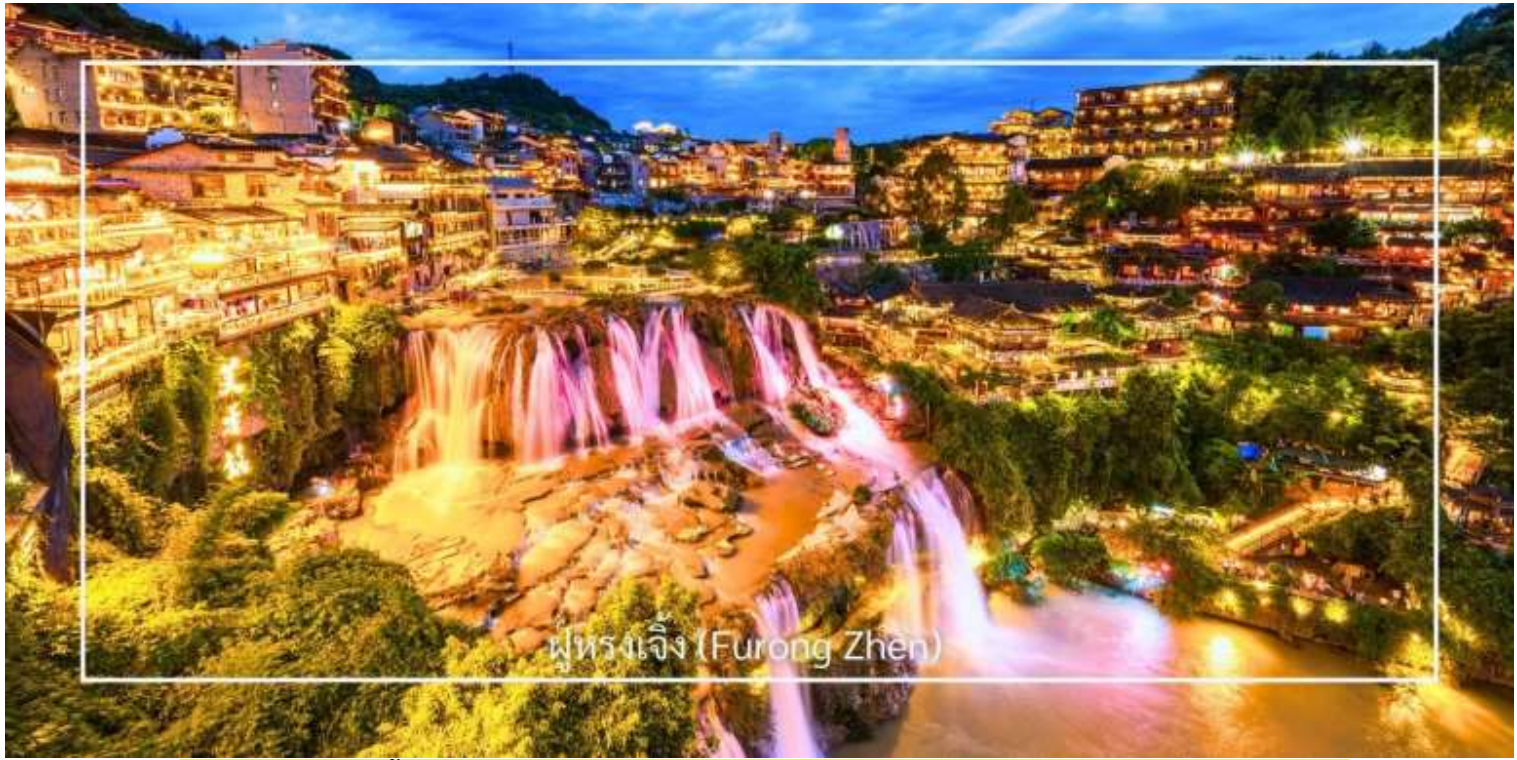
ฟูรงเจิ้ง (Furong Zhen)

ท่านสามารถเลือกซื้อบริการเสริม (Option) เพิ่มเติมได้: สะพานกระจกแกรนด์แคนยอน 400 หยวน/ท่าน สัมผัสประสบการณ์สุดตื่นเต้นกับการเดินบนสะพานกระจกใส ที่ทอดยาวเหนือหุบเขาสูง ให้ท่านได้ชมทัศนียภาพอันงดงาม แบบพาโนรามา พร้อมท้าทายความกล้าท่ามกลางบรรยากาศธรรมชาติอันยิ่งใหญ่