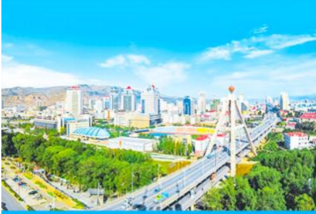
เมืองซีเหมิน