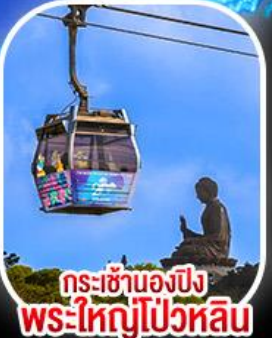
กระเช้าเองปีง พระใหญ่โป่วหลิน