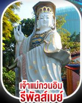
เจ้าแม่กวนอิม รีพีลส์เบย์