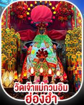
วัดเจ้าแม่กวนอิม ฮ่องฮำ