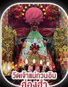
วัดเจ้าแม่กวนอิม ส้องฮ่า