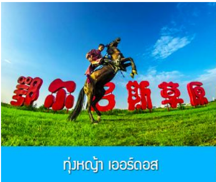
ทุ่งหญ้า เออร์ดอส

พักที่ ORDOS BOYU AIRUI HOTEL โรงแรมระดับ 4 ดาวท้องถิ่น หรือเทียบเท่าในเมืองเออร์ดอส