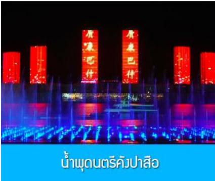
น้ำพุดนตรีคังปาสื่อ