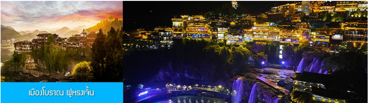
เมืองโบราณ ฟุหยงเจิ้น