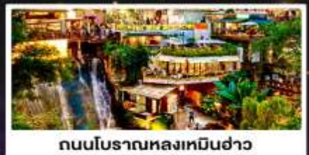
ถนนโบราณหลงเหมินฮ่าว