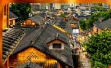
เมืองโบราณสี่ปาตี