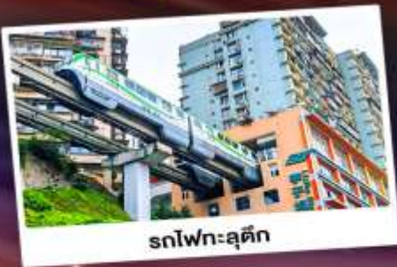
รถไฟฟ้าทะลุตึก