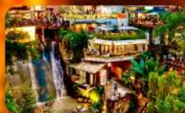
ถนนโบราณหลงเหมินฮ่าว