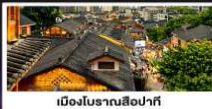
เมืองโบราณสี่ปาที้