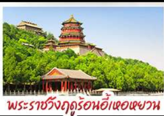
พระราชวังฤดูร้อนอ้าเฮอเฉาหวาน

ท่าแพงเมืองจินค่านจวียงกวน - พระราชวังฤดูร้อนอ้าหอยวน สวนจิ่งอัน - วัดลามะ - ไม่หลงร้านช้อปปิ้ง - โรงแรม 4 ดาว มือพิเศษ เปิดปีกกึ่ง สุกม็องโท MICHELIN GUIDE ร้าน TAO TAO JU