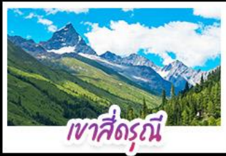
เขาสี่ดรุณี