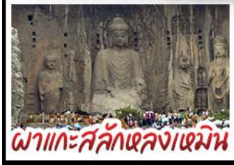
พลาแกะสลักหลงเหมิน

เที่ยวครบ 4 มรดกโลก ถ้ำหลงเหมิน - สุสานจีนซีฮ่องเต้ - วัดเส้าหลิน หมู่บ้านไต้คินसानโจว - หมู่บ้านกัวลี้ยงชุน