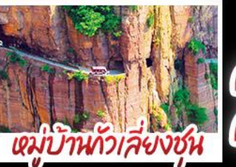
หมู่บ้านกัวลี้ยงชุน