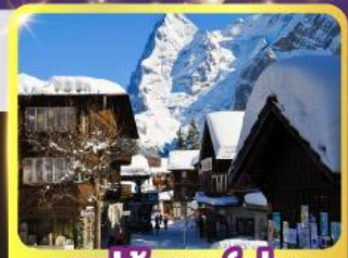
หมู่บ้านมูร์เรน