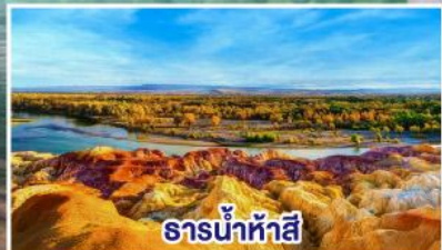
ธารน้ำห้าสี