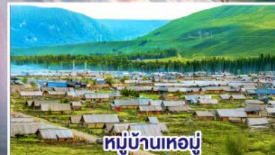
หมู่บ้านหอยมู