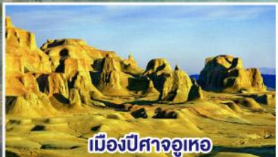
เมืองปีศาจอูเทอ