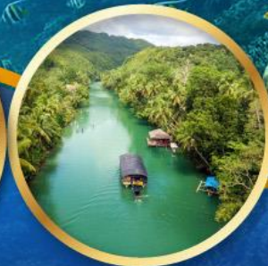
ล่องเรือแม่น้ำโลบ็อก