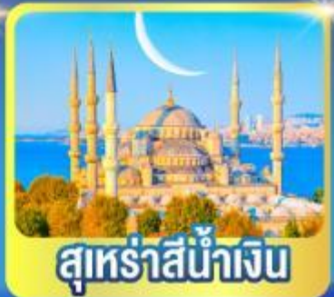
สุหรัสน้ำเงิน