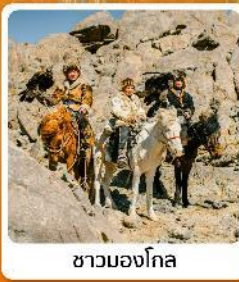
ชาวมองโกล