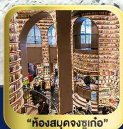
"ห้องสมุดจงชู่เก๋อ"