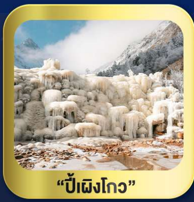
"ปี่ฝิงโกว"

นั่งกระเช้าชมวิว ภูเขาหิมะต้ากู่กลาเซียร์ • ชมความสวยงาม ณ อุทยานปี่ฝิงโกว ห้องสมุดจงชู่เก๋อ • ศูนย์หมีแพนด้า • ตงเจียวจี้ • ซอยกว้างชวยเคบ