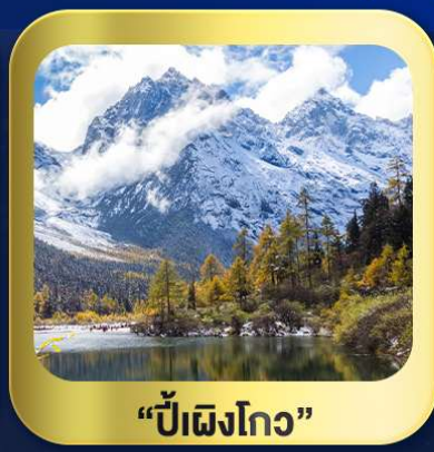
"ปี่ฝิงโกว"