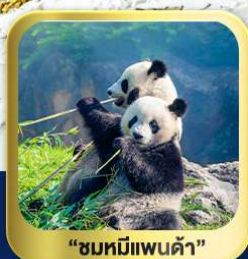
"ชมหมีแพนด้า"