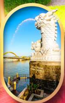
คาร์พดราท้อน