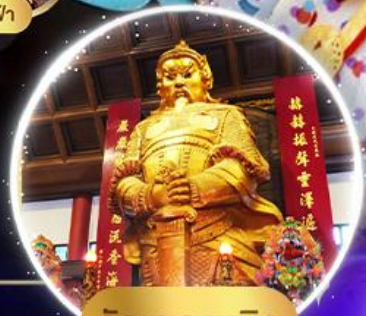
วัดแซกทมิว