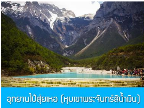
อุทยานปัสุ่ยเหอ (หุบเขาพระจันทร์สีน้ำเงิน)

หมายเหตุ กรณีที่กระเช้าใหญ่ขึ้นภูเขาหิมะมังกรหยกปิดให้บริการ ด้วยเหตุที่สภาพอากาศไม่เอื้ออำนวย หรือเป็นการปิดเพื่อตรวจสอบสภาพและซ่อมแซมประจำปี ทางทัวร์ขอสงวนสิทธิ์ที่จะจัดโปรแกรมขึ้นกระเช้า ที่จุดชมวิวภูเขาหิมะมังกรหยก ณ สถานีกระเช้าหุยนซานผิง แทน