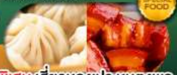
พิเศษ เสี่ยวหลงเป่า หมูแดงพอ เดินทาง ม.ค. - มิ.ย. 69