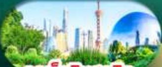
จุดเช็กอินสุดฮิต North Bund Shanghai

เซี่ยงไฮ้ หางโจว ล่องทะเลสาบซีหู ฟรีเดย์