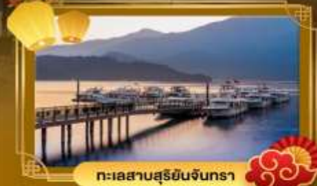
ทะเลสาบสุริยจันทร์