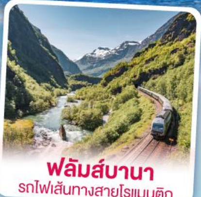
ฟลัมส์บานา รถไฟเส้นทางสายโรเมนติก