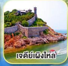
เจดีย์เฝิงไหล