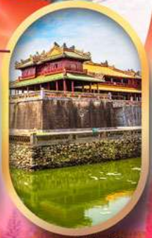
พระราชวังไคโน้ย