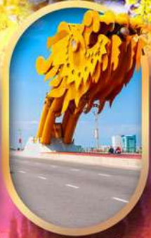
สะพานมังกรดานัง