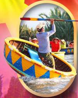
ล่องเรือกระดังง์