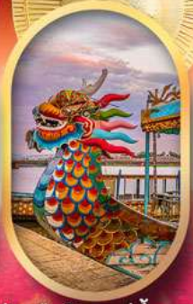
ล่องเรือมังกรแม่น้ำหอม