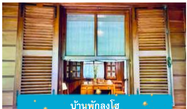
บ้านพักลุงโฮ