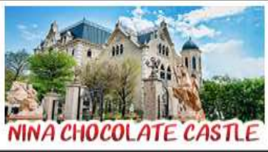
NINA CHOCOLATE CASTLE

ทะเลสาบสุริยจันทรา - ไทเป 101 จิวเฟิน - NINA CHOCOLATE CASTLE MONSTER VILLAGE - ชิหมินตง เมนูพิเศษ ปลาประธนาธิบดี เซียวหลงเป่า / ซาบูไต้หวั่น