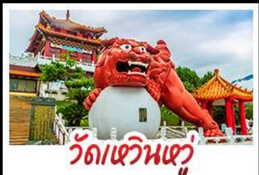
วัดเขวินเฮวู