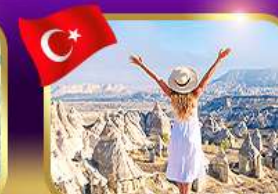
ชมความงาม หุบเขาแห่งรัก