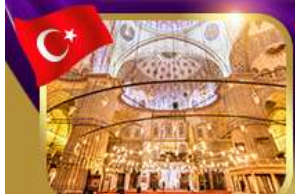
เข้าชมความงามสุเหร่าสีน้ำเงิน