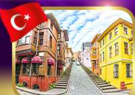
ชมบ้านหลากสีย่านบาลีก