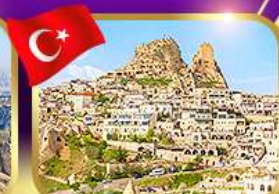
หุบเขาอูชิซาร์ คัปปาโดเกีย