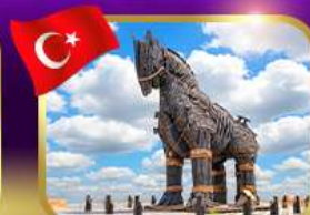
น้ำม้าเมืองทรอย ซานิคคาล