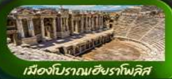
เมืองโบราณเฮียราโพลิส

อิสตันบูล ปามุคคาเล คัปปาโดเกีย ERCIYES MOUNTAIN SKI