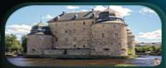
ปราสาทไอโรโร