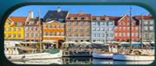
ย่านนูฮาวน์