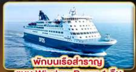
พักบนเรือสำราญ แบบ Window Room 1 คืน

สัมผัสความเป็นที่ที่สุดของ สแกนดิเนเวีย ให้ท่านได้พักผ่อนแบบ SLOW LIFE