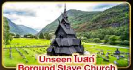
Unseen โบสถ์ Borgund Stave Church