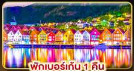
พักเบอร์เกน 1 คืน