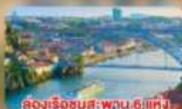
ล่องเรือชมสะพาน 6 แห่ง ในคูร์เมืองปอร์โต