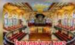
โรงละครบัลเลต์ เดลา มูสิคกา คาตาลา