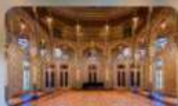
Palacio de la Bolsa