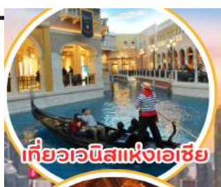
เที่ยวเวนิสแห่งเอเชีย