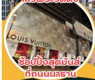
ช้อปปิ้งสุดมันส์ ที่ถนนนาธาน