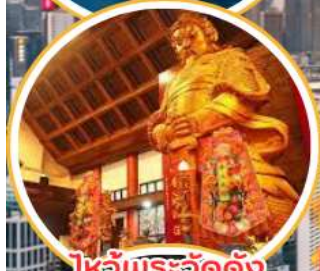
ไหว้พระวัดดัง