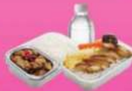
บริการอาหารร้อนบนเครื่อง ซาโป - ซากสับ