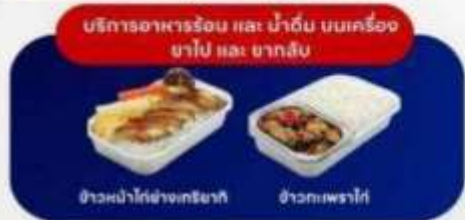
บริการอาหารร้อน และ น้ำดื่ม บนเครื่อง ขาไป และ ขากลับ