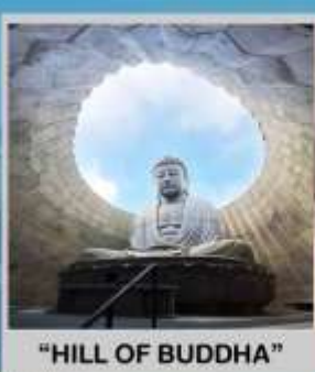
"HILL OF BUDDHA"