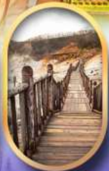
หุบเขาจิกุกดาบิ