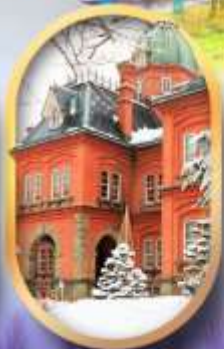
ศาลาว่าการฮอกไกโด