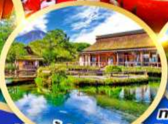
หมู่บ้านน้ำใสโอชิโนะฮัทโก