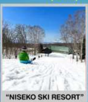
"NISEKO SKI RESORT"