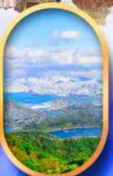
ทะเลสาบมิกะตะ