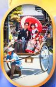
ศาลเจ้าจิ้งจอก