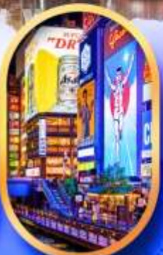
ย่านชิบะฮะชิ