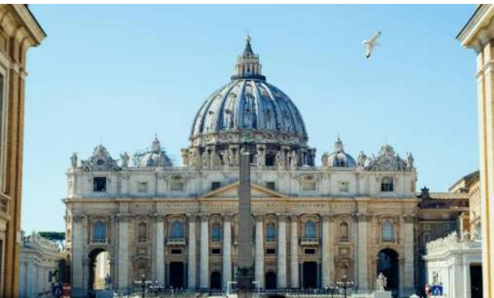
มหาวิหารนักบุญปีเตอร์ ( ST. PETER' BASILICA)

(กรณีมีพิธีด้านใน หรือถ้าหากมีผู้เข้าชมเป็นจำนวนมากจนไม่สามารถเข้าชมได้ทันเวลา ทั้งนี้เพื่อมิให้กระทบต่อกำหนดการท่องเที่ยวอื่นๆ ภายในโปรแกรมทัวร์" อาจจะไม่ได้รับการเข้าชม)