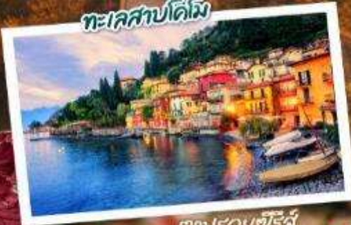
ตามรอยซีรีส์