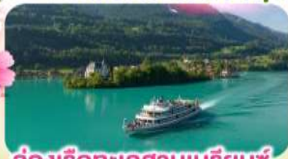
ล่องเรือทะเลสาบเบรียนซ์

พิชิตยอดเขาชุณหะเนกกา 1 ในเขาที่สวยงามที่สุดเมืองเซอร์แมท