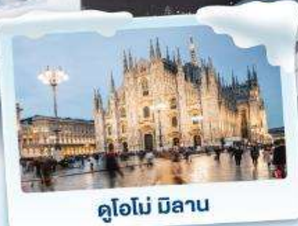
คูโอโม มิลาน