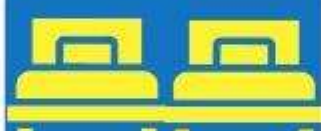
ห้องพักเตียงคู่ TWIN