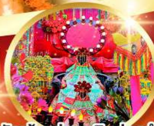
วัดเจ้าแม่กวนอิมฮองอ่า