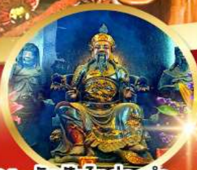
วัดปึกไคฮองอ่า