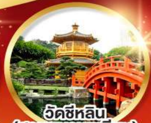
วัดซีหลิน