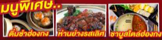
ต้มยำฮ่องกง ห่านย่างรสเลิศ ซาซุสโตสต์ฮ่องกง