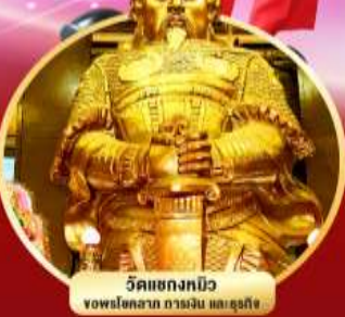
วัดเขกทงกิว ขอพรโชคลาภ การเงิน และธุรกิจ