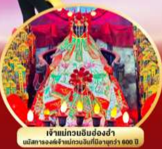
เจ้าแม่กวนอิมย้งฮงฮ่า นมัสการองค์เจ้าแม่กวนอิมที่มีอายุกว่า 600 ปี