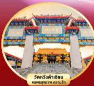
วัดหวังต้าเซียน ขอพรสุขภาพ ความรัก