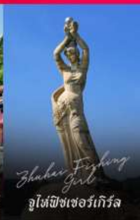
Zhuhai Fighting Girl จูไห่พิชเชอร์เกิร์ล