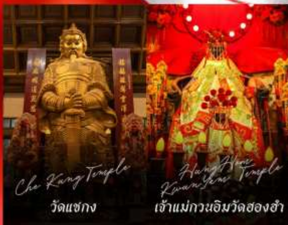
Che Kung Temple วัดแชกง

รายการทัวร์ข้างต้นอาจมีการปรับเปลี่ยนเพื่อความเหมาะสม