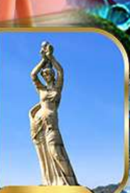
จูไห่ฟิชเชอร์รี่