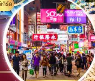
Shopping Tsim Sha Tsui