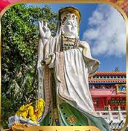
เจ้าแม่กวนอิม พลัสเบย์