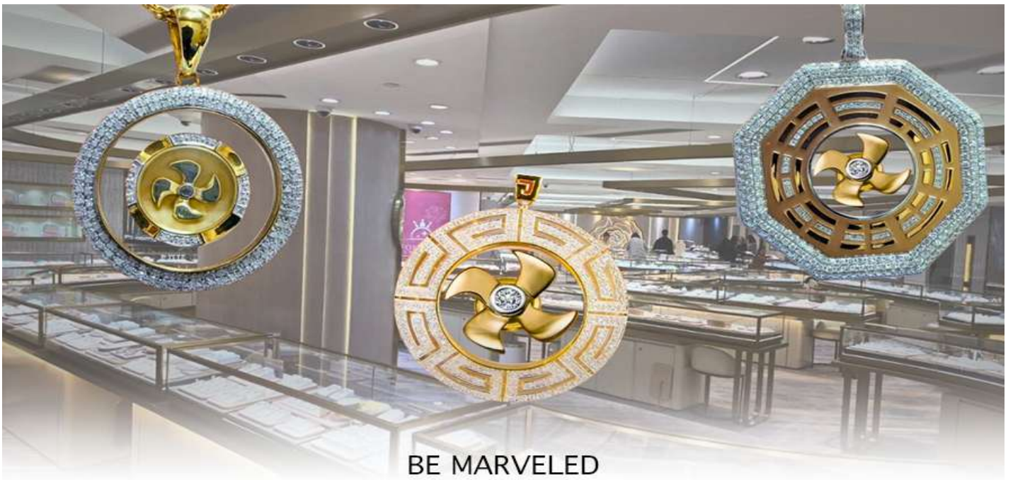
BE MARVELED ศูนย์ฮวงจุ้ย กัททันเศรษฐี

นำท่านชม ศูนย์ฮวงจุ้ย กัททันเศรษฐี ที่ขึ้นชื่อของฮ่องกง ท่านจะได้พบกับงานดีไซน์ที่ได้รับรางวัลยอดเยี่ยม และใช้ในการเสริมดวงเรื่องฮวงจุ้ย โดยการย่อใบพัดของกังหันที่เป็นสัญลักษณ์ของวัดวัดเซ่งมิม มาทำเป็นเครื่องประดับ ไม่ว่าจะเป็นจี้, แหวน, กำไล หรือต่างหูเพื่อเป็นเครื่องประดับติดตัว และเสริมดวงชะตา ซึ่งสินค้าทุกชนิด มีเอกสาร รับประกันคุณภาพเปลี่ยนหรือซ่อม ได้ตลอดอายุการใช้งาน หากเกิดการชำรุดจากสินค้าไม่ใช่อุบัติเหตุ