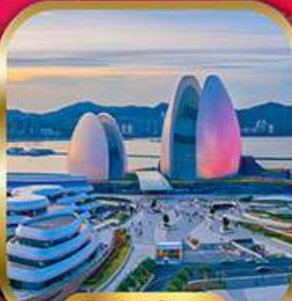
Zhuhai Opera House