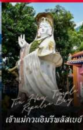
Tin Hau Temple Repulse Bay เจ้าแม่กวนอิมรัชส์สเบย์