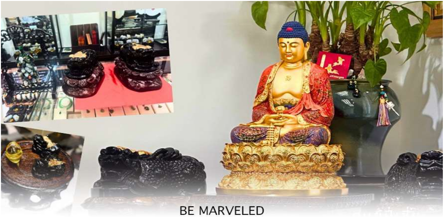
BE MARVELED ศูนยี่ปี่เซี่ยะ

และนำท่าน ชม ศูนยี่ปี่เซี่ยะ ซึ่งคนจีนนั้น ถือว่าหยกเป็นหิน ที่เป็นตัวแทนของความสวยงามและความบริสุทธิ์มีความเชื่อว่า หยก มงคล ถ้าพกติดตัวไว้จะอายุยืนและสุขภาพดีมีสินค้ำมากมายเกี่ยวกับหยก อาทิ กำไลหยก หรือสัตว์นำโชคอย่างปี่เซี่ยะ ให้ ท่านได้เลือกซื้อเป็นของฝาก, ของที่ระลึก หรือของนำโชคแต่ตัวท่านเอง