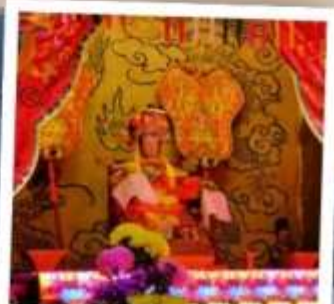
เจ้าแม่ทับทิม จอสเฮาส์เบย์